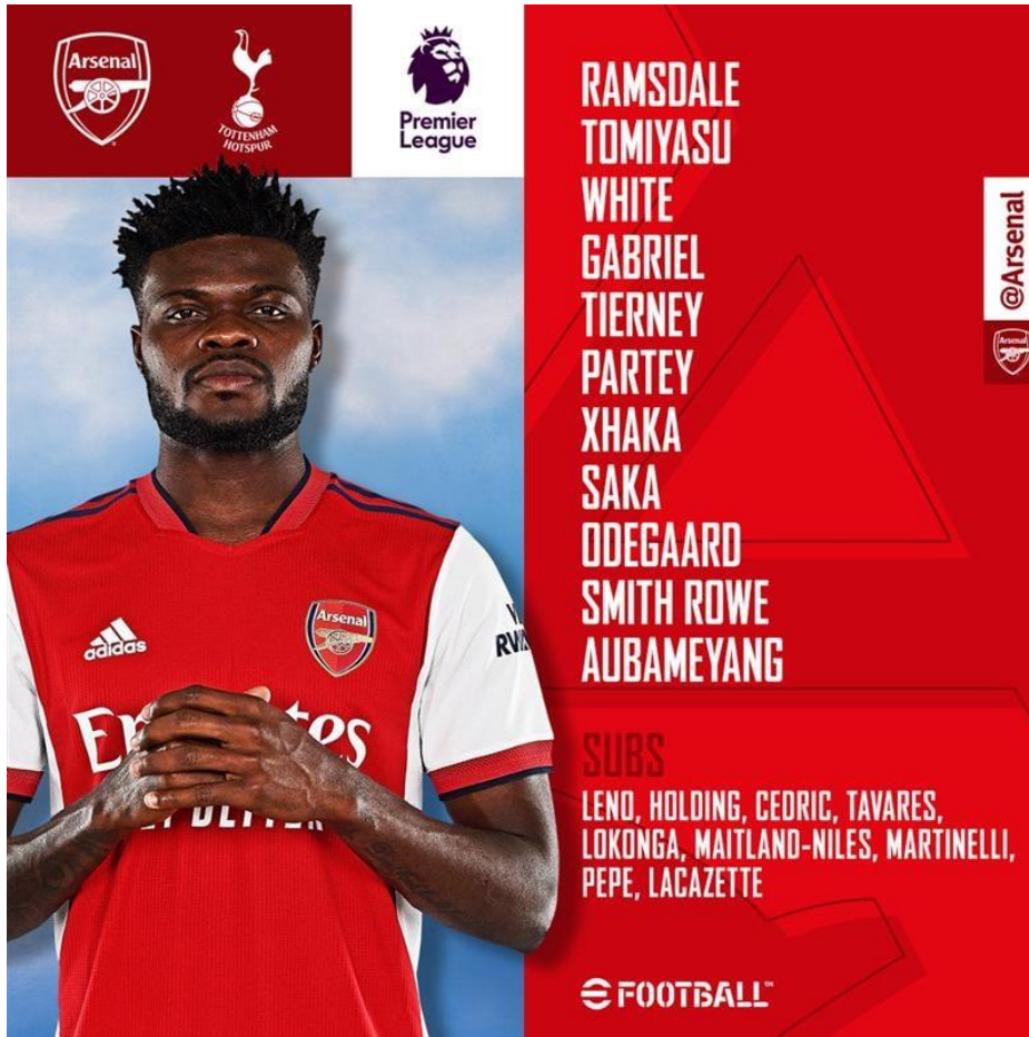
圖 2 出場陣容頭三場聯賽